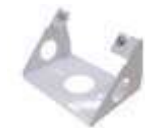
A092 SUPORTE DE INSTALAÇÃO A 45°